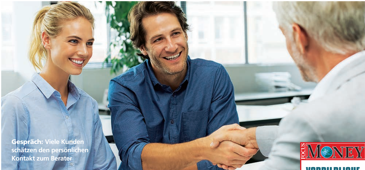
Gespräch: Viele Kunden schätzen den persönlichen Kontakt zum Berater